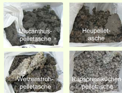
Aschen aus der Verbrennung im Reka-Kessel, Glühverluste 0,2 – 5,5 %