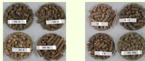
Einfluss des Einsatzes von Dolomitkalk auf das Ascheschmelzverhalten und die Pelletfestigkeit