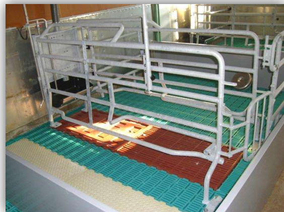
Bewegungsbucht der Firma WEDA (links) und von PORCON-PIGTEK (rechts)