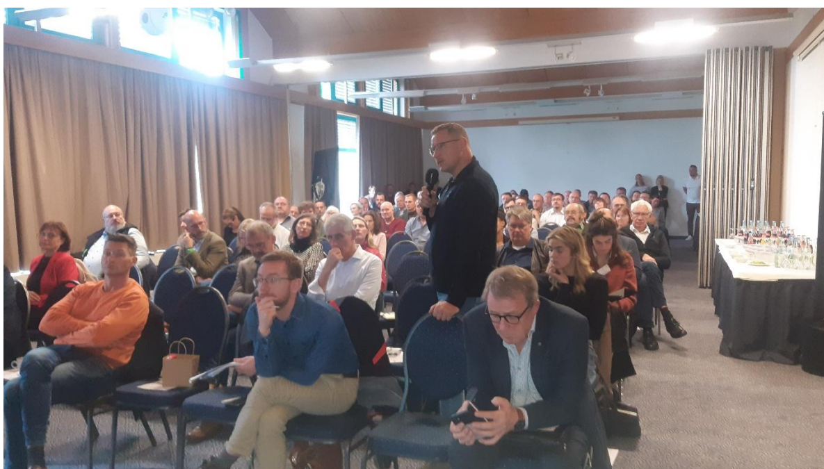
Foto 4: Kritische Fragen wurden vom Fachpublikum mit den Referenten intensiv diskutiert.

Eine Evaluierung geeigneter Maßnahmen zur Verringerung von Emissionen soll bis Mitte 2026 erfolgen. Anschließend werden im Zuge der neuen IED die überarbeiteten neuen Betriebsvorschriften (ehemals als »Beste Verfügbare Techniken (BVT)«) in die zukünftigen Anforderungen an Tierhaltungsanlagen ab 2030 einfließen.