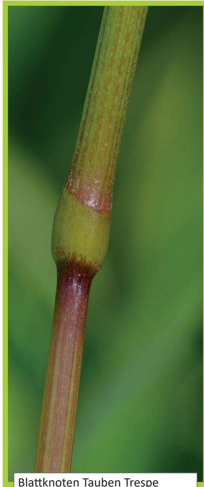
Blattknoten Tauben Trespes ( Bromus sterilis , unbehaart)