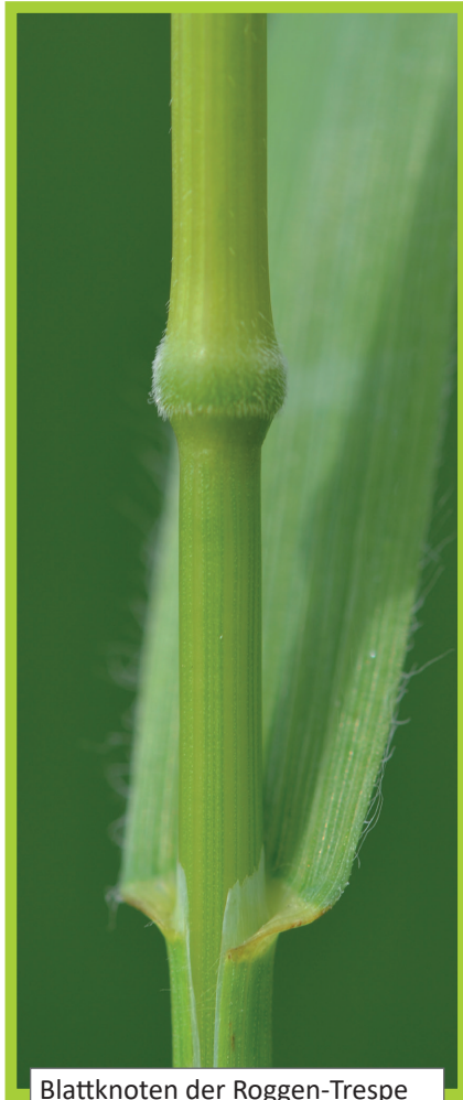
Blattknoten der Roggen-Trespes ( Bromus secalinus , behaart)