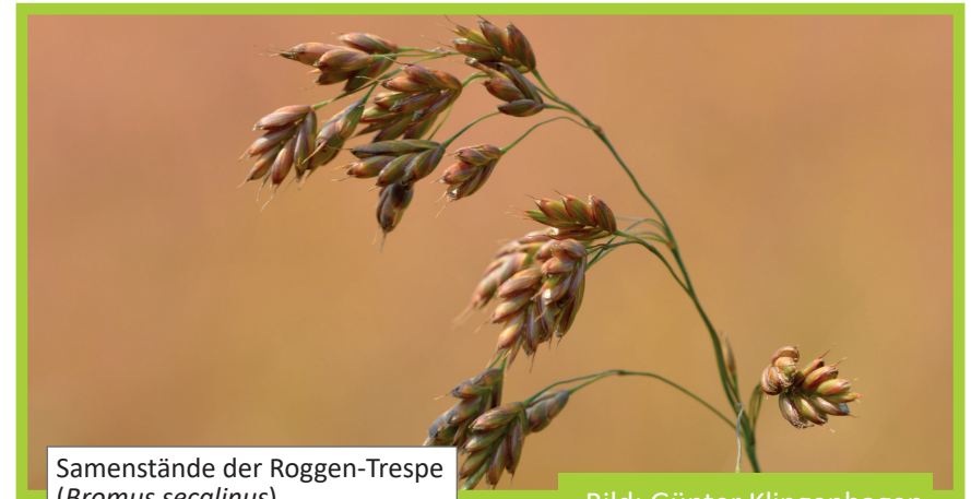
Samenstände der Roggen-Trespes ( Bromus secalinus )

Die Trespes-Arten sind an der Keimblattspitze abgerundet. Die Keimblätter und die jungen Pflanzen sind intensiv behaart, bei älteren Pflanzen ist die Behaarung aber oft weniger deutlich. Blattöhrchen sind nicht vorhanden. Trespes-Arten weisen ein 2-4 mm langes, gezähntes Blatthäutchen auf. Die Taube Trespes besitzt eine lockere Rispe, die 15 bis 30 cm lang werden kann. Diese reift frühzeitig und knickt im Halm dabei häufig ein. Die Samen sind schlank, ca. 1 cm lang und weisen eine Granne mit ca. 2 bis 3 cm Länge auf. Die Roggen-Trespes hat einen aufrechten Wuchs und überwächst die Kulturen. Die Rispe ist mit 10 bis 15 cm Länge kompakter und die Deckspelzen sind mit ca. 8 mm kürzer begrannt.