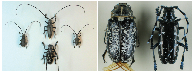
Links: männliche Käfer der drei in Deutschland und Österreich vorkommenden Monochamus -Arten mit ALB (unten Mitte); Rechts: Walker und ALB (rechts).

Eine Verwechslung der erwachsenen Käfer mit heimischen Insekten ist auf Grund ihrer Färbung kaum möglich. Am ähnlichsten sind die Monochamus -Arten M. galloprovincialis , M. sutor und M. sartor , deren Wirtsbäume jedoch Nadelgehölze sind. Ein selten vorkommender, großer schwarzer Käfer mit weißen Zeichnungen auf den Flügeldecken ist der Walker ( Polyphyllo fullo ). Er gehört zu den Blatthornkäfern und ähnelt aufgrund seiner Körperform eher einem Maikäfer.